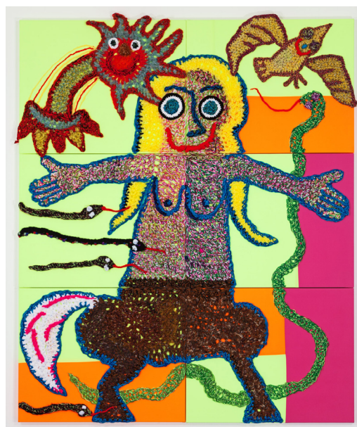
Centauresse , 2021 Crochet sur toile / crochet on canvas 240 x 200 cm / 94 1/2 x 78 2/3 in