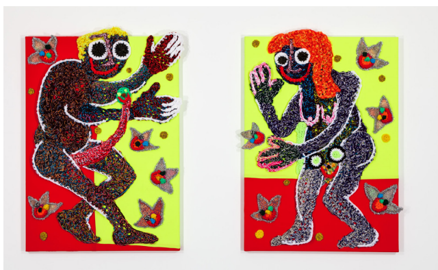
Les nus , 2021 Crochet sur toile / crochet on canvas 140 x 100 cm / 31 1/2 x 39 1/3 in (chaque / each)