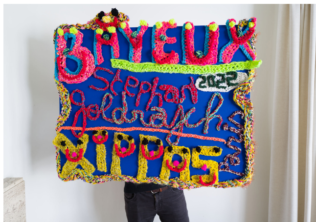
Stephan Goldrajch, Bayeux , 2021. Crochet sur toile, 80 x 100 cm. © Stephan Goldrajch.

Inauguration le samedi 22 janvier, 11h - 20h