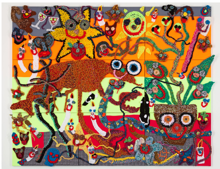
Festin , 2021 Crochet sur toile / crochet on canvas 240 x 300 cm / 94 1/2 x 118 in