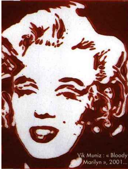
Vik Muniz : « Bloody Marilyn », 2001...