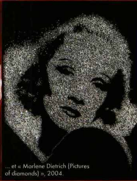
... et « Marlene Dietrich (Pictures of diamonds) », 2004.