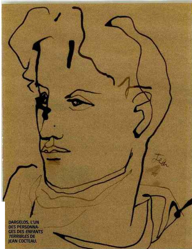
DARGELOS, L'UN DES PERSONNAGES DES ENFANTS TERRIBLES DE JEAN COCTEAU.