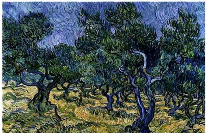
EXCEPTIONNEL : 40 PEINTURES ET DESSINS DE VAN GOGH À GÈNES.

L'un des trésors cachés du musée de Grenoble ? Son fonds d'art graphique. Quelque 3 500 dessins anciens reposent en effet bien à l'abri de la lumière, dans les réserves. Cette exposition met l'école française à l'honneur, avec des esquisses (parfois très abouties) dès la Renaissance. Les artistes français se révèlent épris de mesure, mais aussi très friands de paysages, comme le montrent les belles études de la fin du XVIII e siècle de François Boucher et d'Hubert Robert.