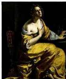
MADELINE DÉPEINTE PAR LA TALENTEUSE ARTEMISIA.

***👤 Peinture XVII e . Fille du peintre Orazio Gentileschi, Artemisia (1593-1652) fut l'une des rares femmes artistes du XVII e siècle. Son nom est passé à la postérité en raison de sa vie dramatique (elle fut violée par son professeur, le peintre Agostino Tassi), mais aussi de son immense talent. Artemisia, qui adopta les effets de clair-obscur et les visages expressifs du Caravage, s'imposa en effet dans toute l'Italie avec des tableaux à la fois raffinés et sanglants, comme Judith