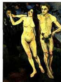
PEINTRE ET MÈRE D'UN PEINTRE : VALADON BAIGNE DANS L'ART.