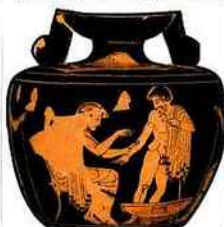
SUR CE VASE DU V e AV. J.-C., UNE CONSULTATION MÉDICALE !

***👤 Sculpture, céramique, objets I er -III e apr. J.-C. Chirurgie, ophtalmologie, obstétrique : ces disciplines étaient déjà bien connues des Romains. Apportée par les Grecs au III e siècle avant notre ère, la médecine est pratiquée à Rome par de nombreux spécialistes, qui disposent de tout un attirail ad hoc (scalpel, sonde, speculum)