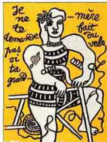
UNE PLANCHE DE CIRQUE, LIVRE DE LÉGER SUR LES FORAINS.

*** Peinture, dessin, gravure, céramique XX e . « Le cirque a été l'événement de mon enfance et voilà qu'il est revenu dans ma peinture », disait Fernand Léger (1881-1955) à la fin de sa vie. Ce