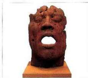
MAURO CORBIA, «Le Vestige», fonte de fer, 2010

Fondation pour l'Art Contemporain Salomon 74290 Alex Tél. : 04 50 02 87 54 www.fondation-salomon.com