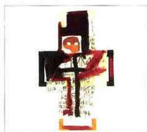
JEAN-MICHEL BASQUIAT, crisis X, 1982. c. Succession Jan Krugier

Musée des Ursulines 5 rue Ursulines - 71000 Mâcon Accès personnes à mobilité réduite, 5 rue Préfecture Tél. : 03 85 39 90 38 www.musees-bourgogne.org