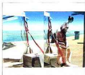
Sans titre, 2011. Huile sur toile, 200 x 300 cm, diptyque, c. Annik Wetter