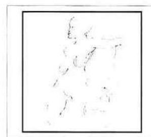
PAYSAGE IRLANDAIS, 2001, 70cm, 2011, huile sur toile

Musée Régional d'Art Contemporain Languedoc-Roussillon 146, avenue de la Plage - BP4 34410 Sérignan - France Tél. : +33 (0)4 67 32 33 05 http://mrac.languedocroussillon.fr