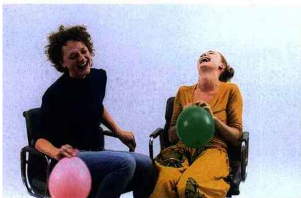
© ESTHER SCHIPPER, BEUIN 2010 / © E. GARAUT