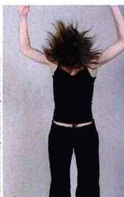
A gauche : Verbal-Nonverbal (extrait) de Christoph Keller (2010).