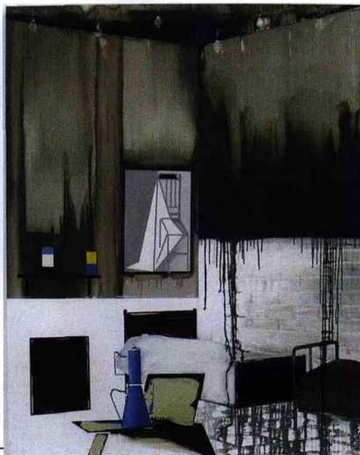
Les toiles de Farah Atassi remettent la peinture sur le devant de la scène de l'art contemporain.